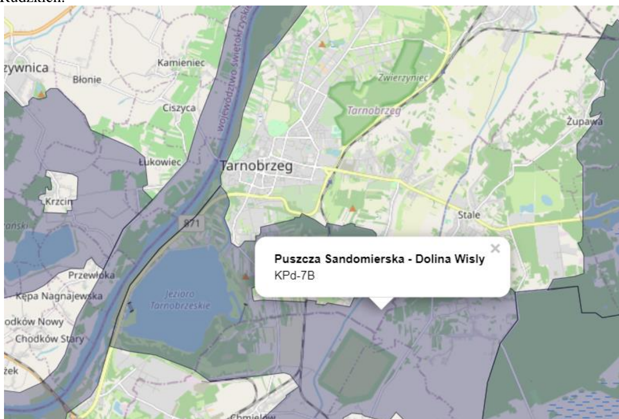
Rysunek 1 Położenie korytarza ekologicznego w sąsiedztwie MPZP 3

Góry Słonne, Pogórze Przemyskie, Pogórze Dynowskie, parki krajobrazowe: Czarnorzecko-Strzyżowski, Pasma Brzanki, Ciężkowicko-Rożnowski i Wiśnicko-Lipnicki, następnie przechodzi przez Beskid Wyspowy, Gorce, Beskid Makowski, Beskid Żywiecki, Beskid Śląski, Pogórze Śląskie, lasami wokół zbiornika Goczałkowickiego, Lasy Pszczyńsko-Kobiórskie, aż do Lasów Rudzkich.