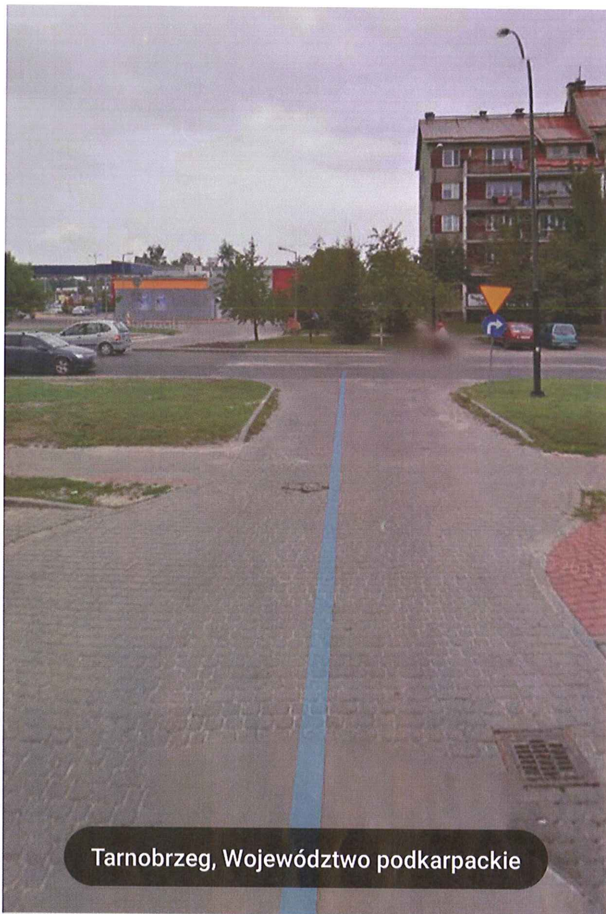
Tarnobrzeg, Województwo podkarpackie