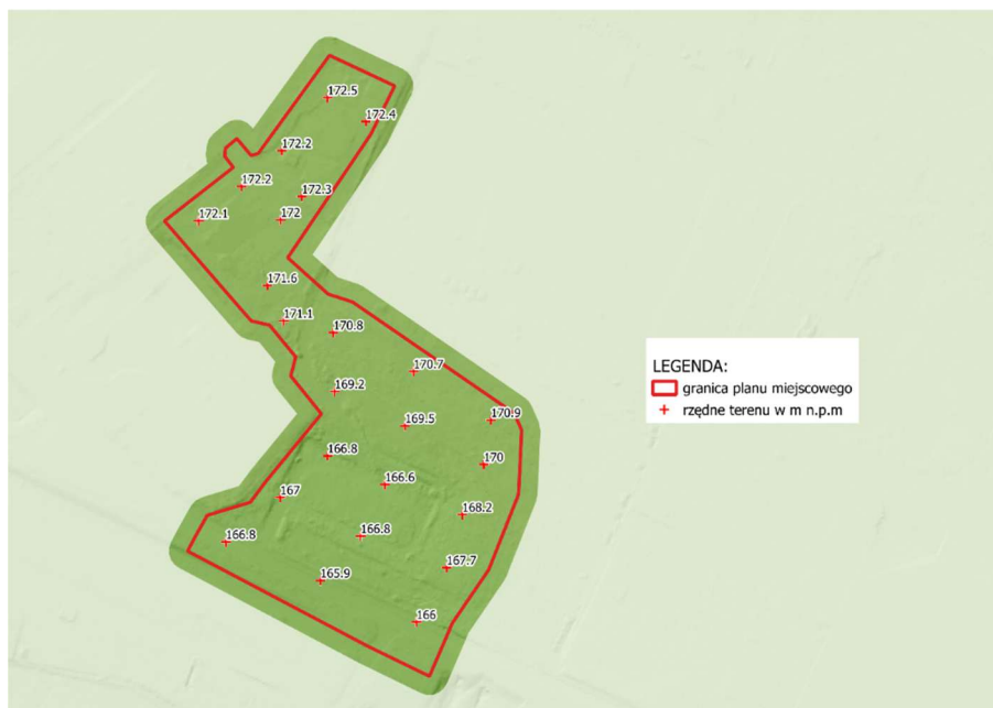
Ryc.3. Rzeźba terenu, źródło: opracowanie własne na podstawie mapy hipsometrycznej geoportal.gov.pl

Teren objęty opracowaniem planu, stanowi obszar położony poza osuwiskami oraz poza terenami predysponowanymi do osuwania się mas ziemnych. Teren jest płaski, o nachyleniu nie większym niż 5°. Na terenie opracowania znajdują się budynki handlowo-usługowe, produkcyjne oraz biurowe, które stanowią część zakładu produkcyjnego Fenix Metals Sp. z o.o.