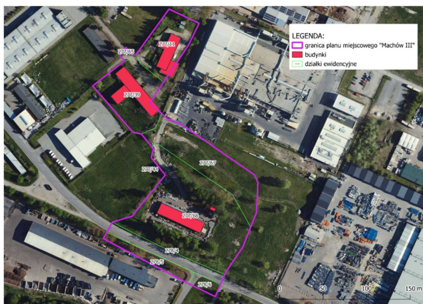
Ryc.2. Działki ewidencyjne w obszarze opracowania, źródło: ortofotomapa o wysokiej rozdzielczości, geoportal.gov.pl

Obszar objęty planem miejscowym jest częściowo zagospodarowany. Analiza danych pozyskanych z Grodzkiego Ośrodka Dokumentacji Geodezyjnej i Kartograficznej z 30.01.2025 r. lic nr GGXI.6642.54.2025_1864_N, tj. mapy zasadniczej, wykazała, że na terenie opracowania znajdują się budynki handlowo-usługowe (budynki magazynowe), przemysłowe oraz biurowe. Przez teren objęty planem miejscowym przebiega droga gminna klasy dojazdowej – ul. Strefowa (nr 122183R).